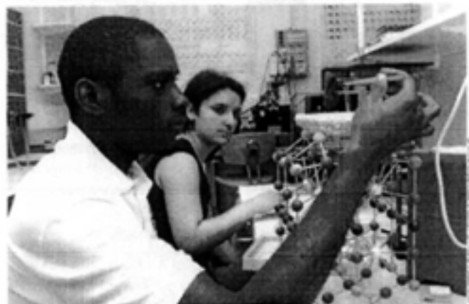
En 1 re année, les étudiants suivent des cours de 3 e année de Polytechnique.

L'explosion de la fusée Ariane 5, le 6 juin 1996, n'aurait jamais dû se produire. A un moindre niveau, de la conception à la réalisation d'une voiture, il faut compter cinq ans et, à chaque étape, des erreurs peuvent se glisser. Au regard de ces dysfonctionnements industriels, Polytechnique lance une chaire consacrée à "l'ingénierie des systèmes complexes". "Pour garder la maîtrise des grands systèmes complexes (industrie aéronautique ou maritime, transport, informatique, etc.), on a de plus en plus besoin de chefs de projets qui théorisent la conception des sous-systèmes", avance Philippe Alquier, directeur de cabinet à l'X.